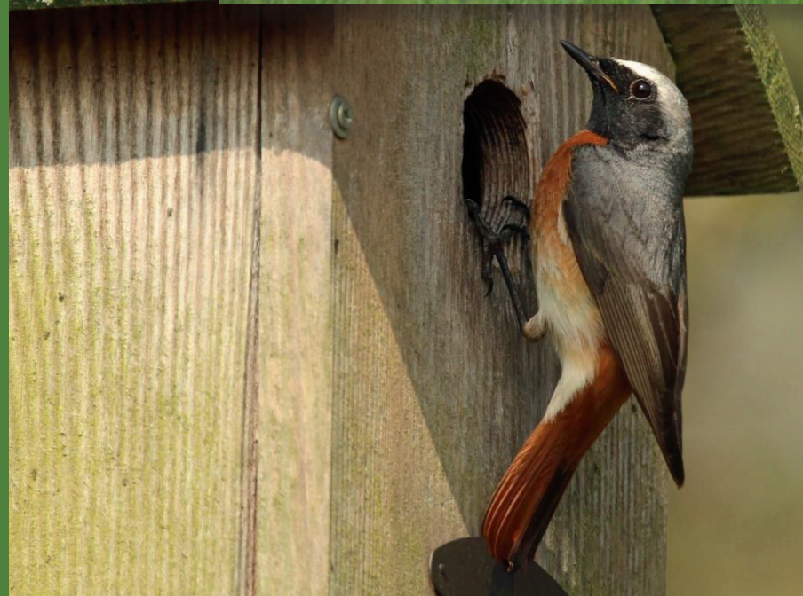
1 Gekraagde roodstaart bij nestkast