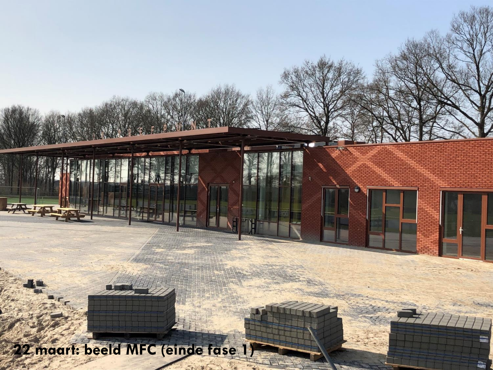
22 maart: beeld MFC (einde fase 1)