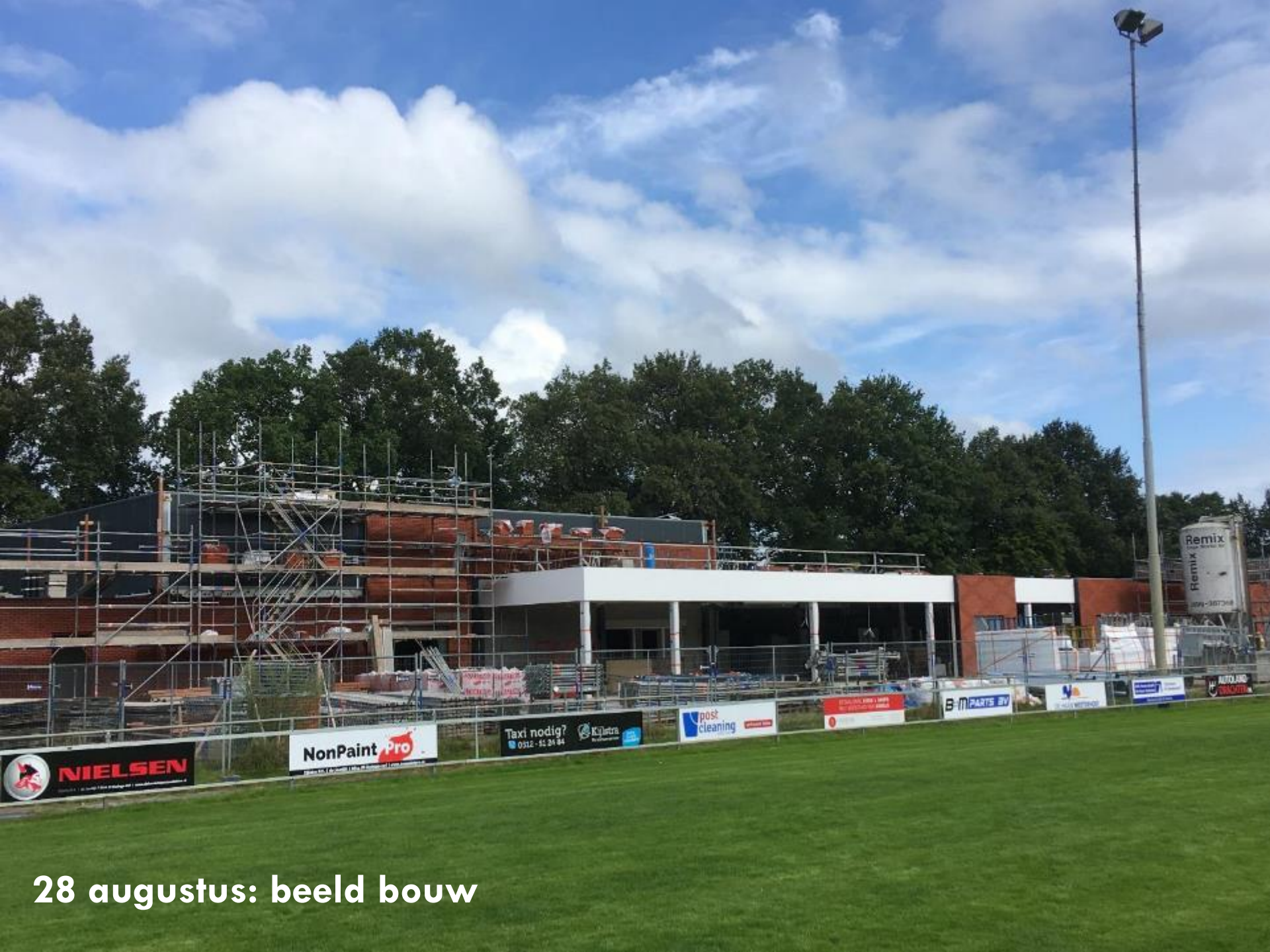
28 augustus: beeld bouw