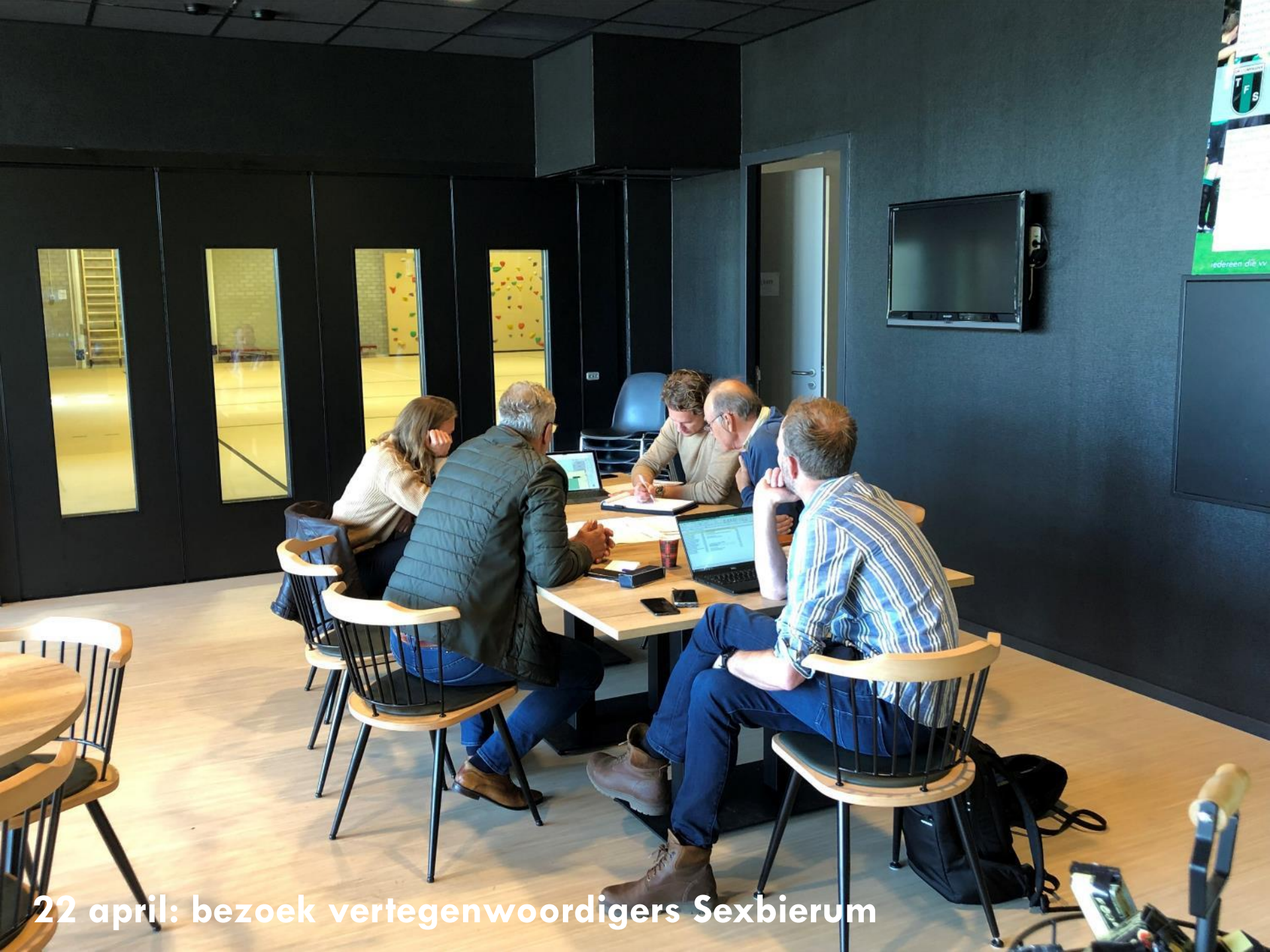
22 april: bezoek vertegenwoordigers Sexbierum