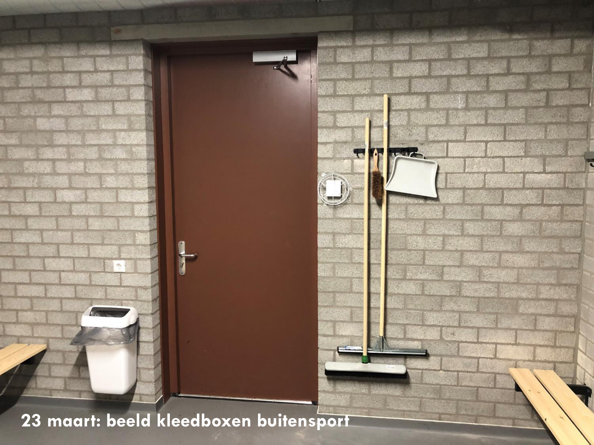
23 maart: beeld kleedboxen buitensport