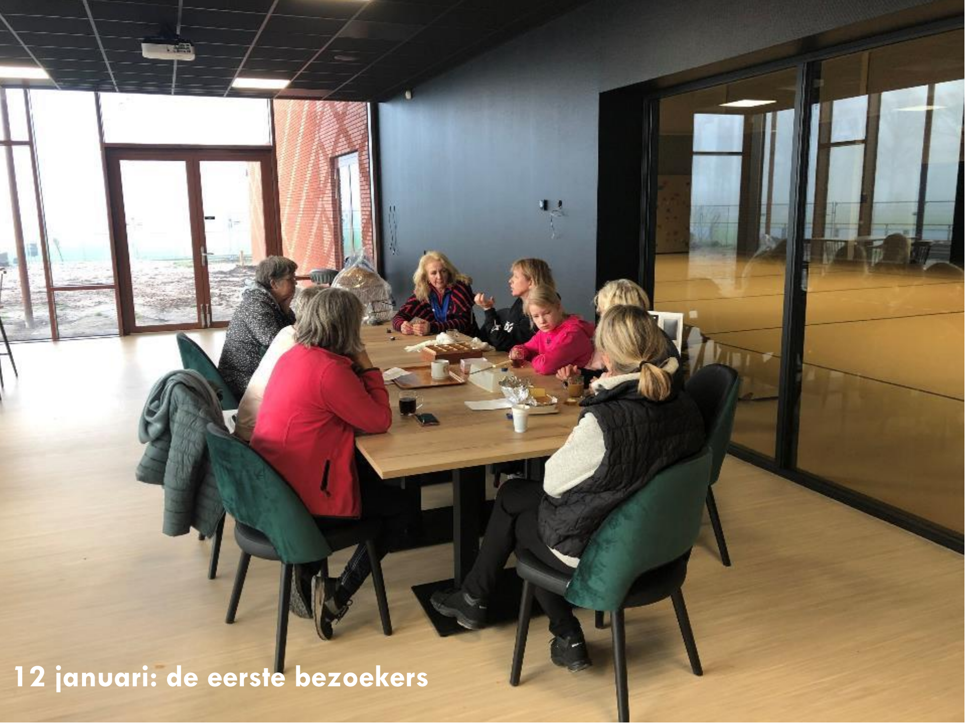
12 januari: de eerste bezoekers