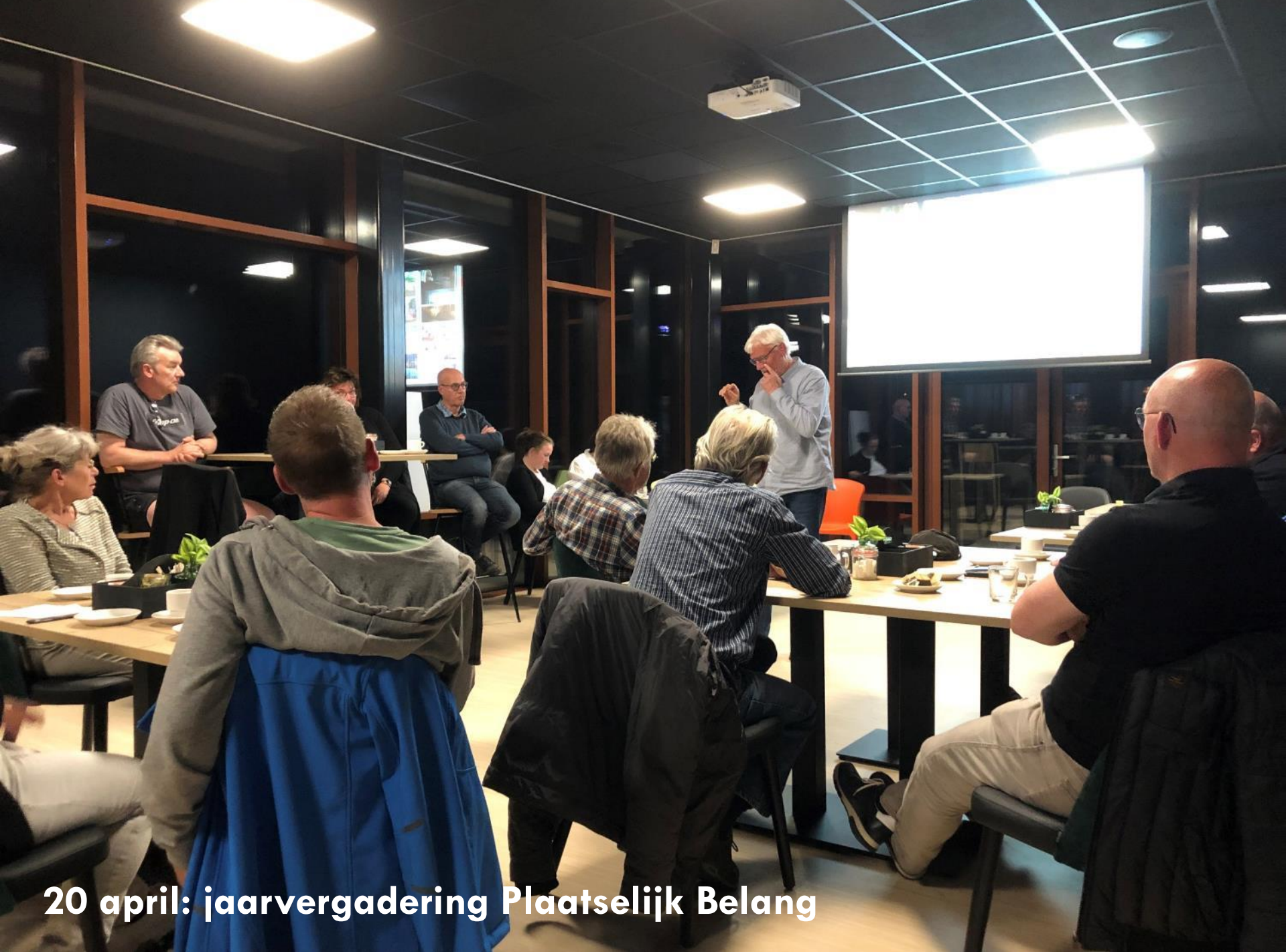
20 april: jaarvergadering Plaatselijk Belang