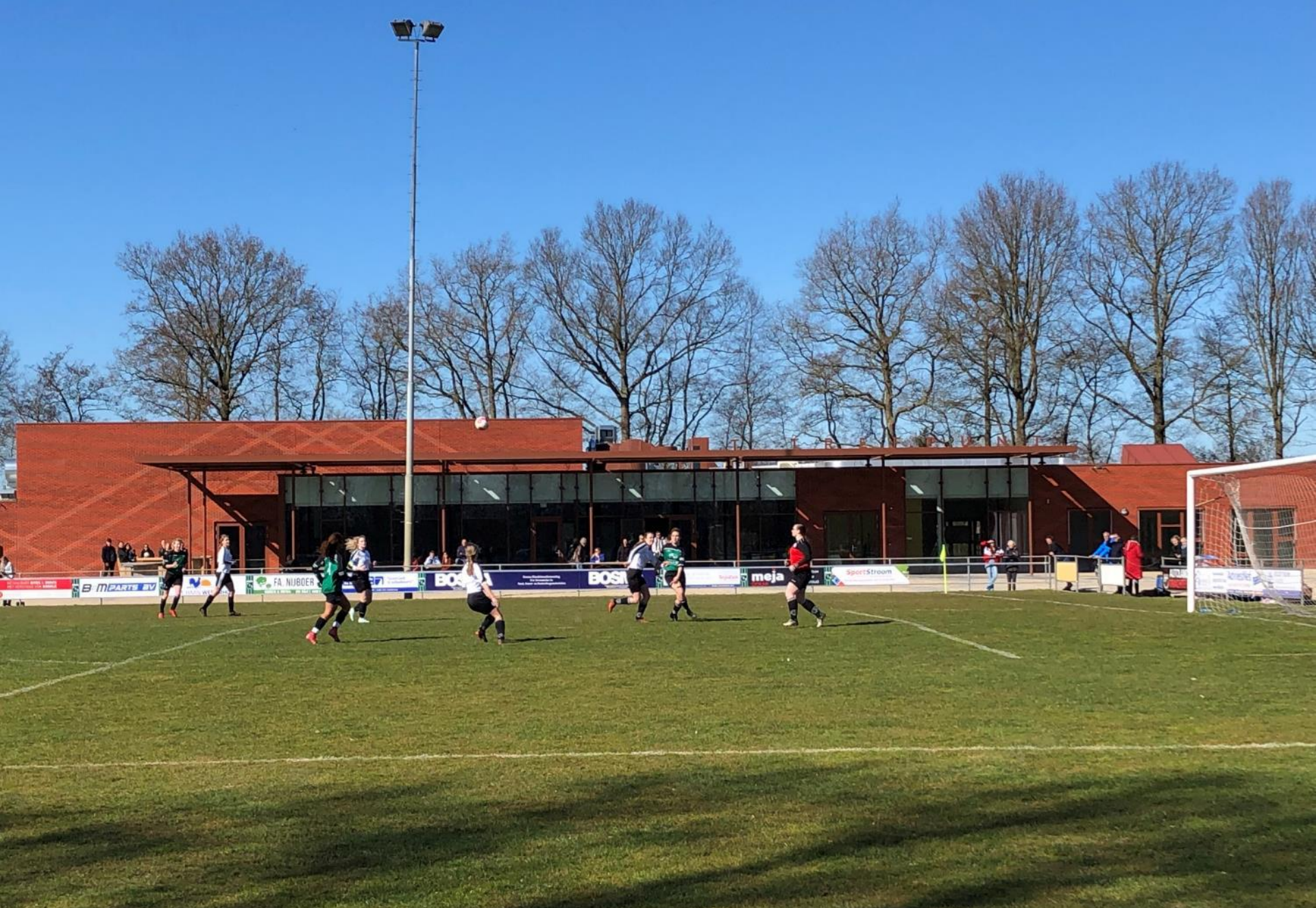
19 maart: beeld MFC vanaf voetbalveld