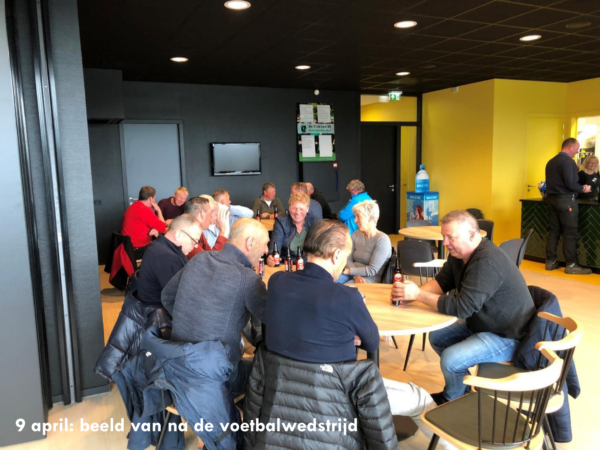
9 april: beeld van na de voetbalwedstrijd