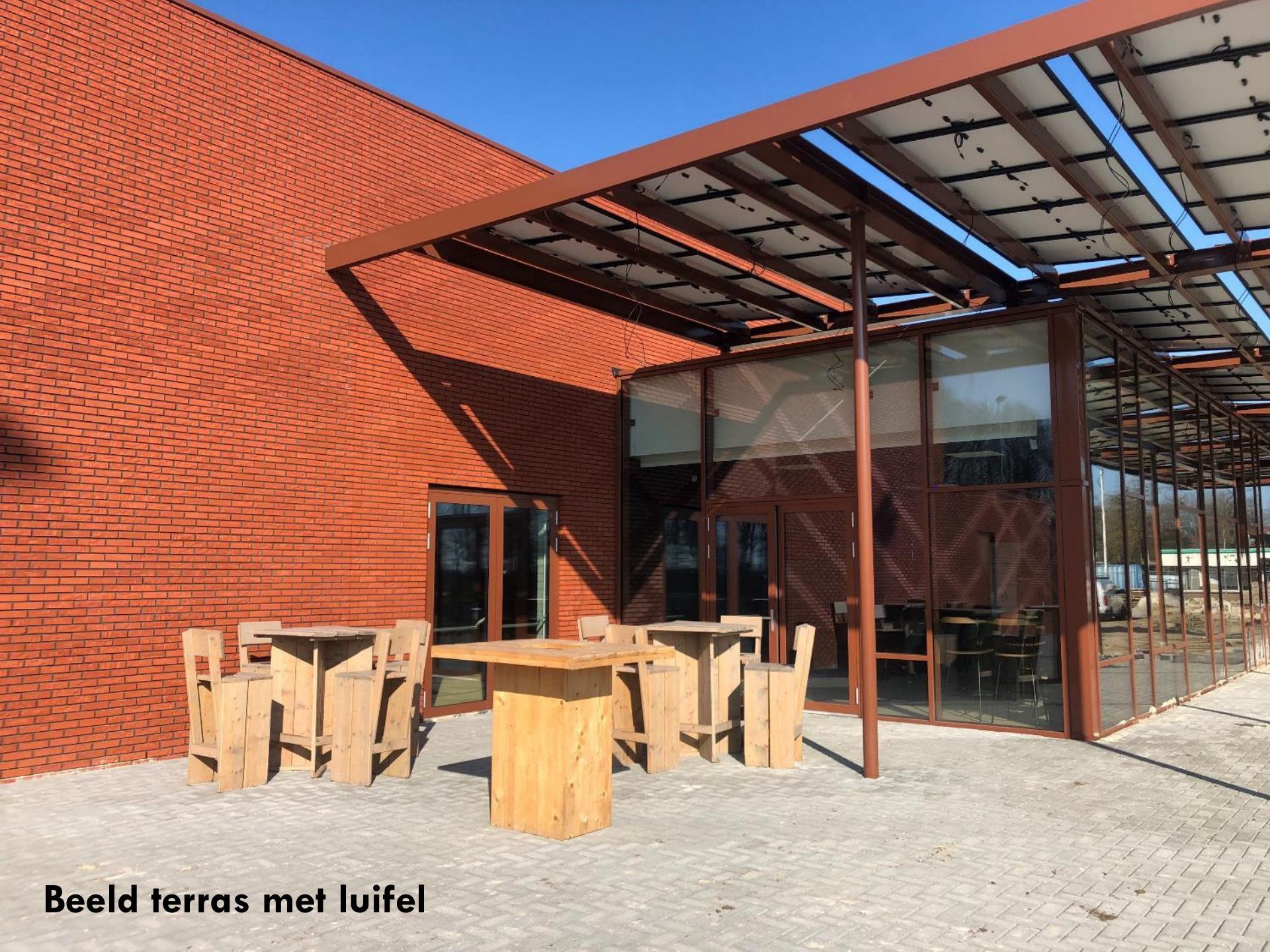
Beeld terras met luifel