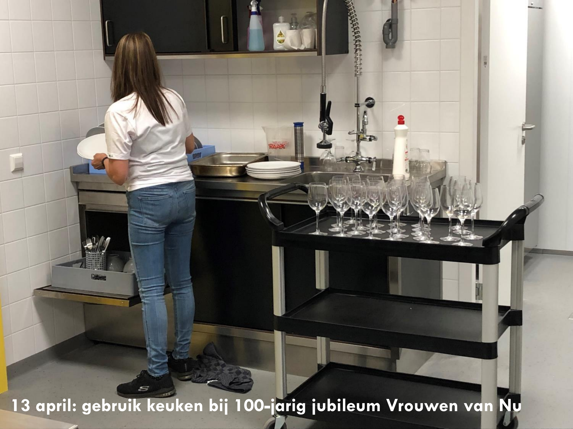
13 april: gebruik keuken bij 100-jarig jubileum Vrouwen van Nu