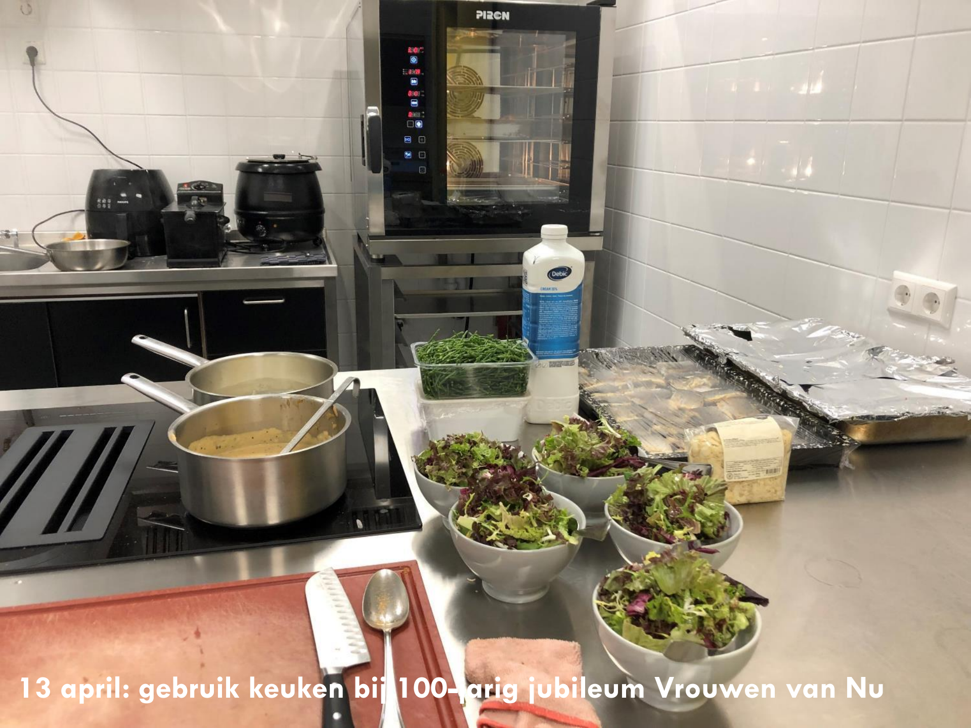
13 april: gebruik keuken bij 100-jarig jubileum Vrouwen van Nu