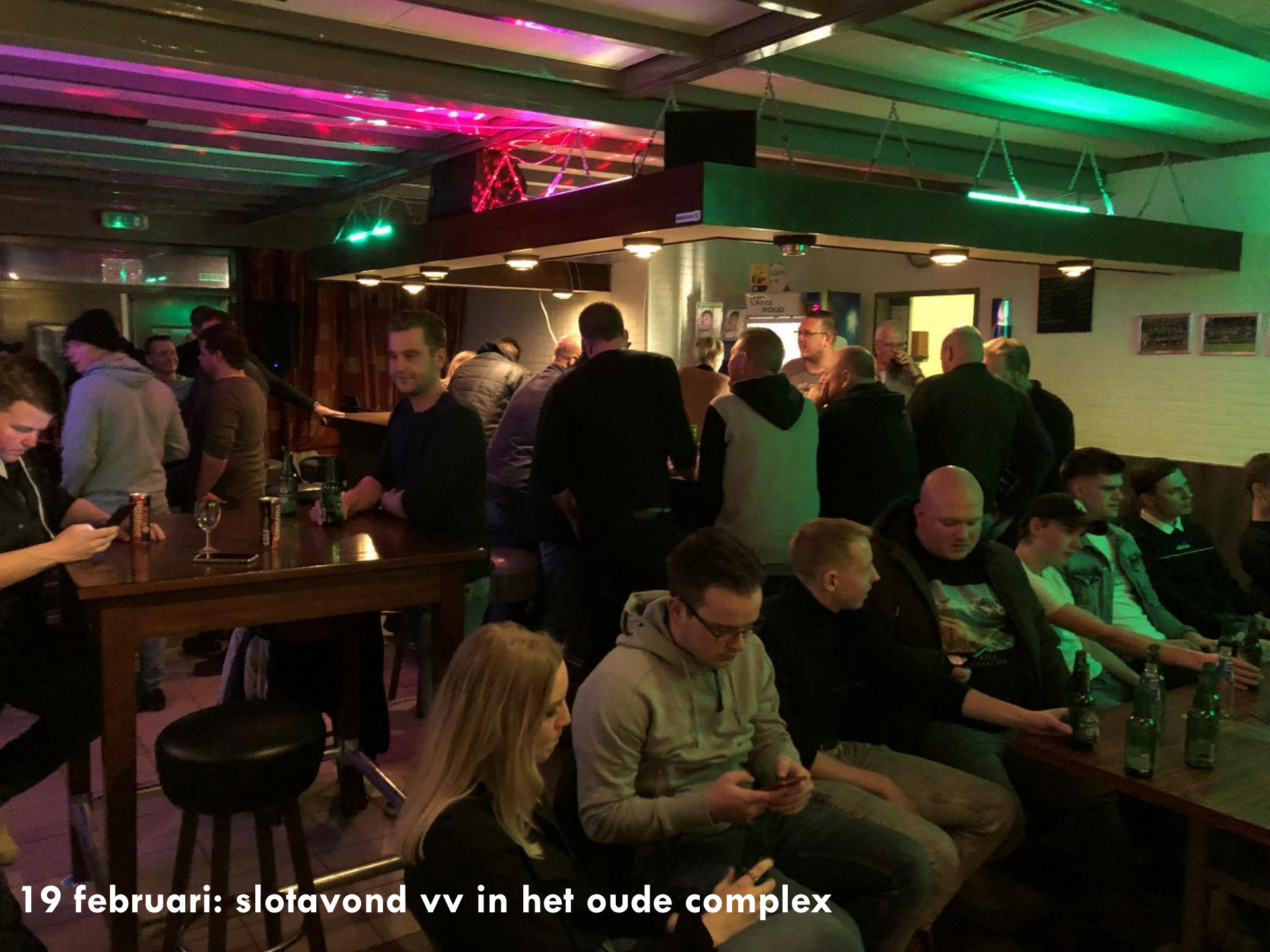
19 februari: slofavond vv in het oude complex