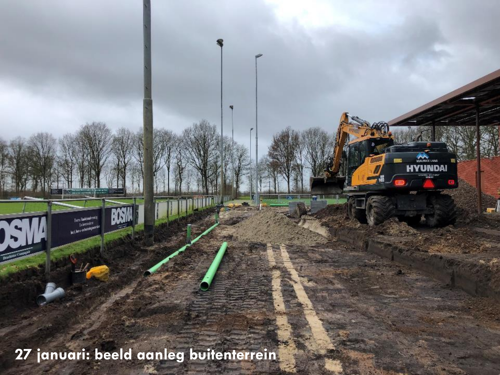
27 januari: beeld aanleg buitenterrein