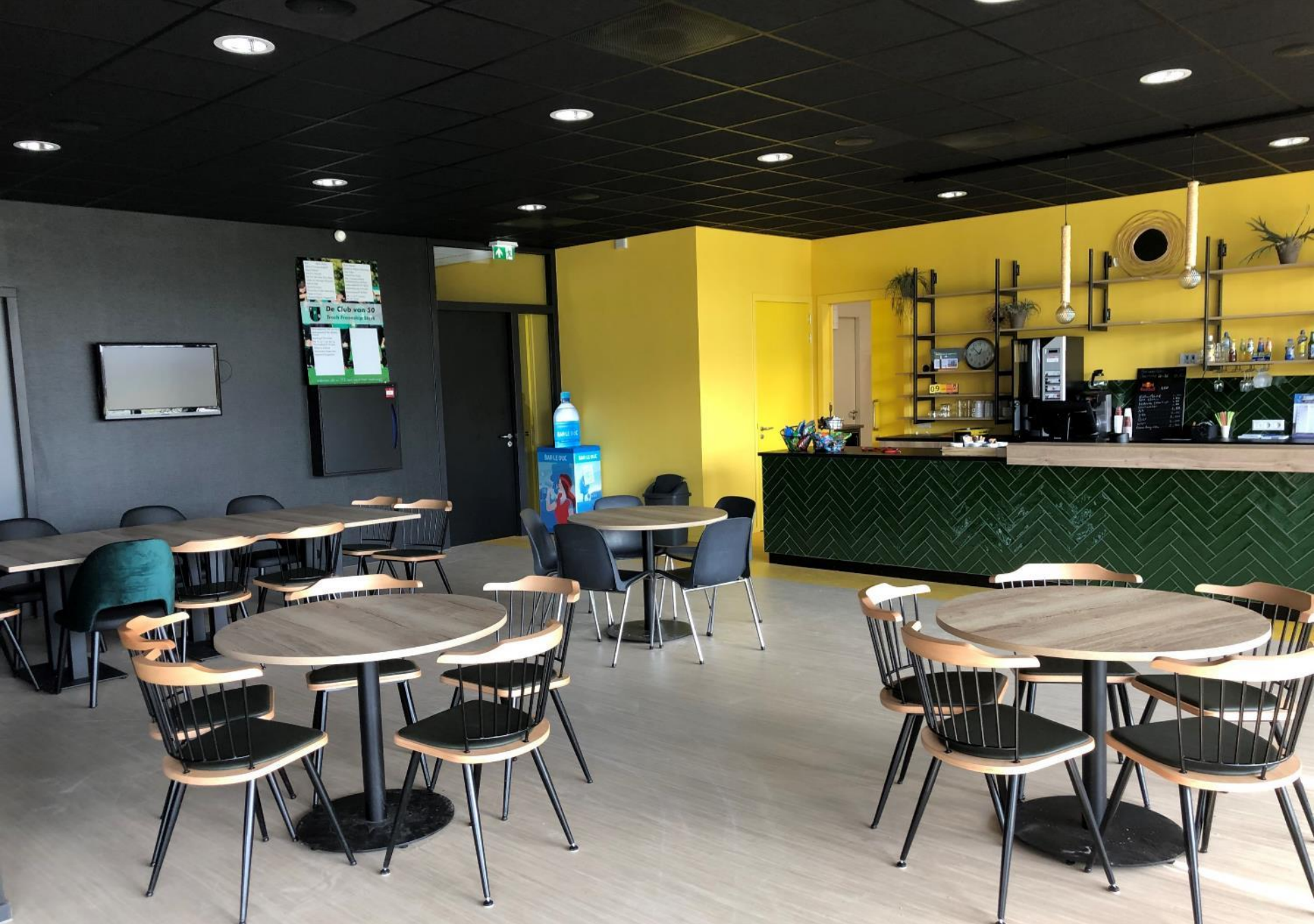
10 april: beeld ontmoetingsruimte sport/dorp