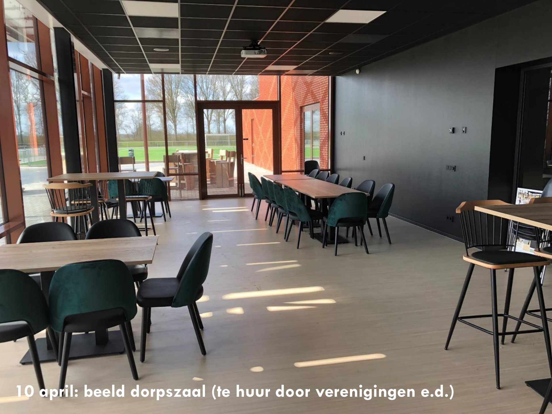
10 april: beeld dorpszaal (te huur door verenigingen e.d.)